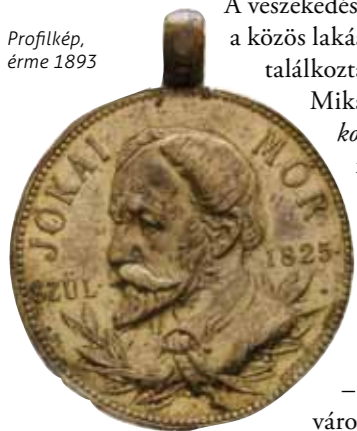
Profilkép, érme 1893

Jókai ötven évig nem is tért vissza a kerületbe. Ez idő alatt a városrészhez politikai kapcsolat fűzte. A regényíró volt ugyanis Terézváros ellenzéki képviselőjelöltje 1869-ben – amikor még a mai Erzsébetváros a Terézváros déli része volt.