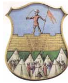
A Jókai család címere

A negyvennyolcas forradalom idején, huszonévesen rövid ideig Erzsébetváros lakója volt Jókai Mór. A regényíró politikai karrierje is kerületünkhöz kötötte, élete utolsó éveiben pedig visszaköltözött a városrészbe.