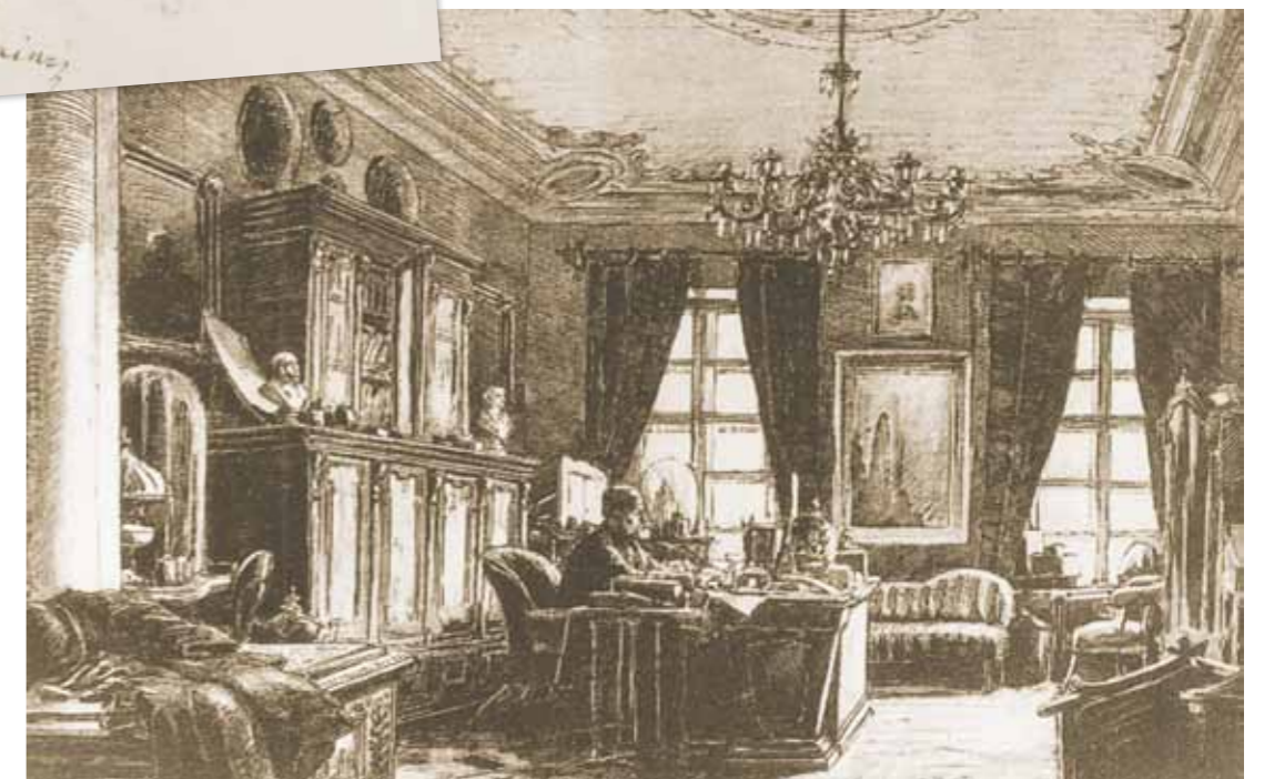
Jókai az íróasztalánál, 1855

Két felvonásban, ötven év különbséggel élt Erzsébetvárosban Jókai Mór regényíró, a márciusi ifjak egyik tagja. Huszonévesen egy Dohány utcai háromszobás lakásban Petőfi Sándorral és feleségével lakott együtt néhány hónapig. Élete utolsó éveiben visszaköltözött kerületünkbe: az Erzsébet körút és a Dob utca sarkán álló bérházba, amelynek oldalán emléktábla őrzi nevét.