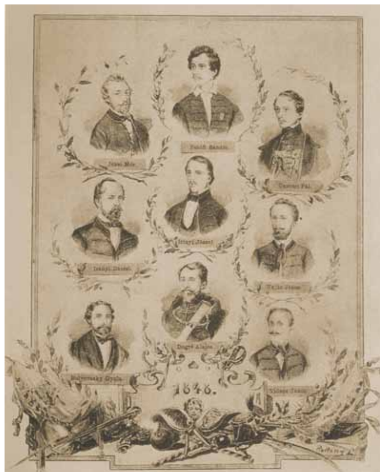
A márciusi ifjak vezetői