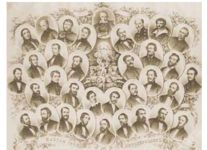
Magyar írók arcképcsarnoka, 1860-as évek